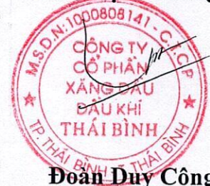
Đoàn Duy Công